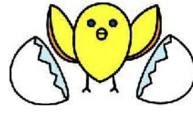
1学年団の誕生だー！